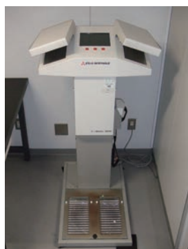
ハンドフットクロスモニター The 7ch hand-foot-clothing monitor

The rooms for radiation experiments and radiochemical operations (unsealed U, Th and sealed 22 Na source), various types of survey-meters, and, 7ch hand-foot-clothing monitor.