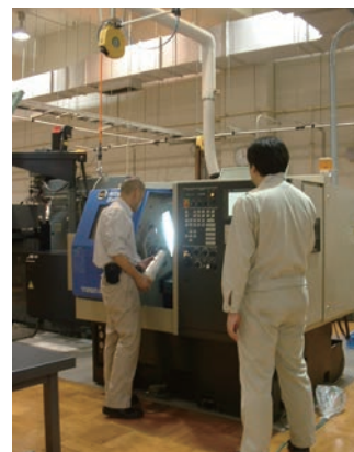
NC 旋盤による作業 Numerically controlled lathe

Metal shop: Five-Axis Universal Machining Center, Numerically Controlled Lathe, Numerically Controlled Milling Machine, Electric Discharge Machining Tool, Glass shop: Lathe for Glass Work, Polishing Tool, Ultrasonic Machining Tool Researcher's Machine Shop: Universal Lathes, Precision Lathes, Milling Machines