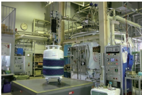
ヘリウム液化機、貯槽および遠心汲上げポンプ Helium liquefier, storage and transfer system