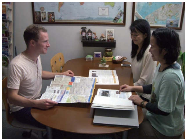
国際交流室 International Liaison Office

The International Liaison Office handles various international matters at ISSP under the supervision of the Committee for international affairs. The major functions are the coordination of a visiting professorship program, the assistance in ISSP international symposiums, and the accumulation of “know-how” for continuous improvement of our services. The office also serves as an information center for researchers from abroad.