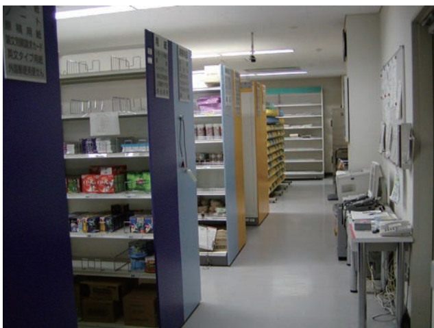
ストックルーム Stock Room

The stock room supplies stationery and parts that are commonly used in research and experiments at low cost. By the automated system control, it is open 24 hours.