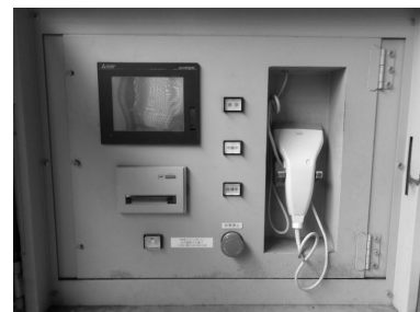
現装置の操作パネル

更新順 【物性研究所汲出場 B棟脇 → 本館脇 → 新領域寒剤室】 11/25-11/29 12/9-12/11 12/11-12/13