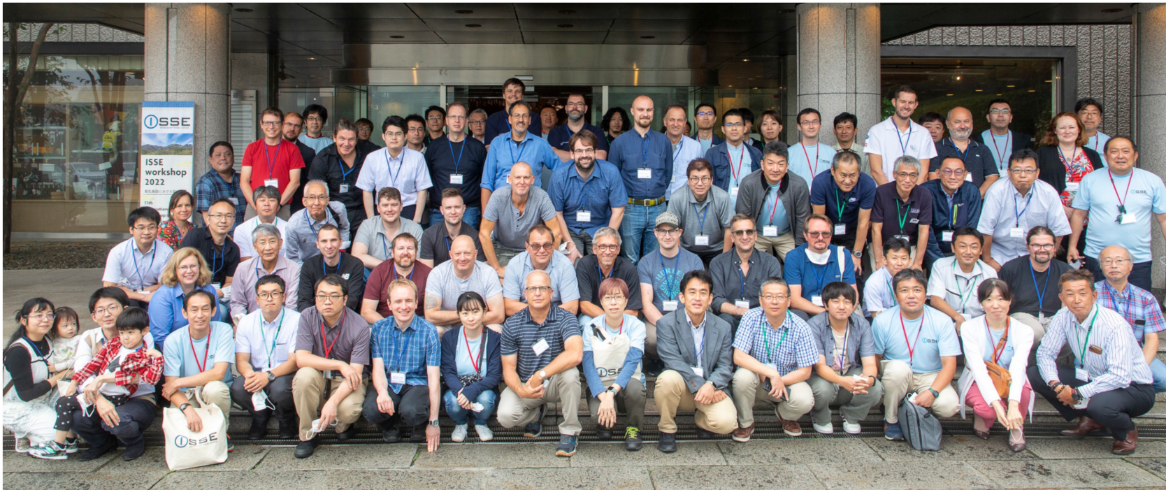
Group photo of the ISSE workshop 2022 participants on 30 August, 2022