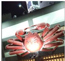
美味かった・・・