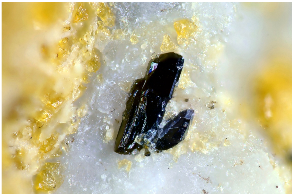
写真 1 ランタンフェリ赤坂石/ランタンフェリアンドロス石(黒褐色結晶)の顕微鏡写真 (FOV = 1mm) どちらも黒色長柱状結晶で産するため、外観からは両者を区別できないが、元素の種類が異なっている。

A1 席に Ca が多く入る種と Mn が多く入る種がみられました(表 2)。このような元素の組み合わせが緑簾石グループに存在することを証明した例は本研究が世界初ということで、両者は新種の鉱物として承認され、前者を「ランタンフェリ赤坂石」、後者を「ランタンフェリアンドロス石」と命名しました。