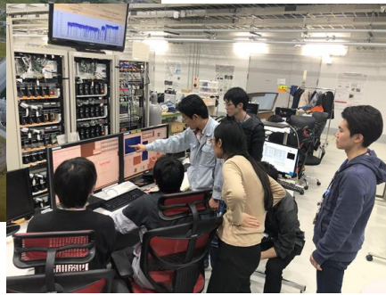
X線自由電子レーザー施設SACLAや東大所有のクリーンルームでの実験の様子