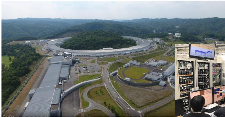
研究に利用している Spring-8 & SACLA

X線自由電子レーザーや放射光、高次高調波といった先端X線光源と、超精密加工法や電子ビームリソグラフィなどの半導体プロセス技術を応用した超精密X線光学素子 を組み合わせたいメージングによって、生物・非生物を問わず、メゾスコピックな微細構造と物性の関係を、従来にない空間・時間分解能で結びつけ、新たなサイエンスを切り拓くことを目指しています。